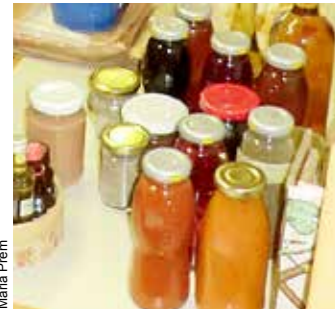
Diverse Erzeugnisse aus Obst und Gemüse.

Sammeln – Tauschen – Vernetzen von oststeirischen Schätzen