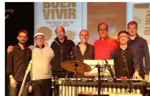
Kongress „Aufbruch zum guten Leben“ – Abschlusskonzert mit Grupo Sal.

K8 Primawera-Saal, Karmeliterplatz 8, Graz