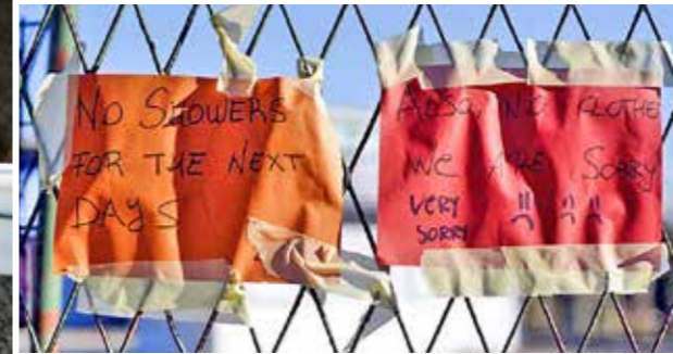
Keine Duschkmöglichkeit und keine Kleider, nachdem No Name Kitchen verboten wurde

Von offizieller Seite gibt es hier das Miral Camp, dass von der IOM (international organisation for migration) betrieben wird. Die Menschen, die dort untergebracht sind, berichten von untragbaren Zuständen dort. Es gibt anscheinend 70 Liter Heißwasser für 600 Menschen. Gerade gibt es Krätze in epidemischen Ausmaßen und keine Möglichkeit, diese unter diesen hygienischen Bedingungen einzudämmen.