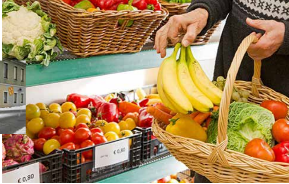
Chance B (2)