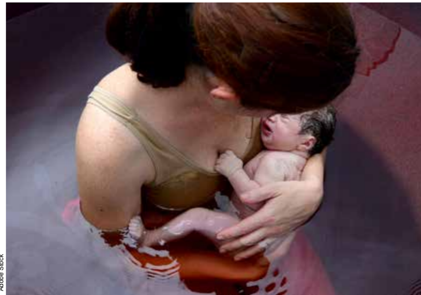
Es wohnt ein Zauber inne...