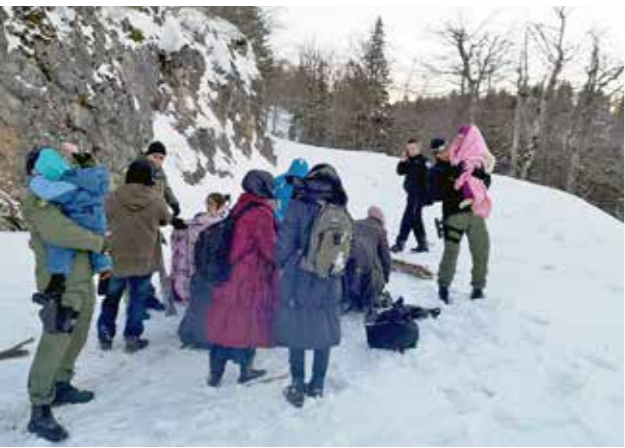
Der Versuch, die EU zu Fuß zu erreichen – vergeblich und gefährlich