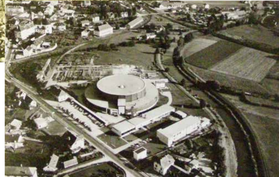
Stadtarchiv Gleisdorf (2)