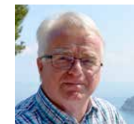
Pensionierter Lehrer der NMS M. Hartmannsdorf

Schabl: Die Sprache und der Kontakt mit der Bevölkerung. Dort wo Kontakte sind, da gibt es keine Berührungsängste, und dort kann auch Integration passieren. Ich halte es für einen ganz, ganz großen Fehler, das ausschließlich in die Hände der Regierung zu geben und zu sagen, alle anderen geht das nichts an. Erstens können sie sich so gar nicht integrieren, das ist gar nicht möglich, und zweitens gibt man einer Gesellschaft, nämlich der österreichischen Gesellschaft, ganz klar die Botschaft, ihr braucht euch um diese Menschen, die am Rande leben, nicht kümmern. Das ist nicht einmal erwünscht. Es verkürzt unser Menschsein – reduziert uns zu Menschen, die auf Leistung, auf Konsum und auf sich selbst hin orientiert sind. Wir haben den Flüchtlingen auch immer ausgedrückt, nach Wien zu gehen, weil es dort schwieriger ist, Arbeit und Kontakt zu finden, weil sie dann in ihrer Community bleiben. In einem kleinen Ort ist das viel einfacher. >>